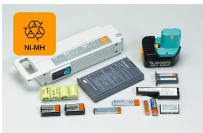
ニッケル水素電池