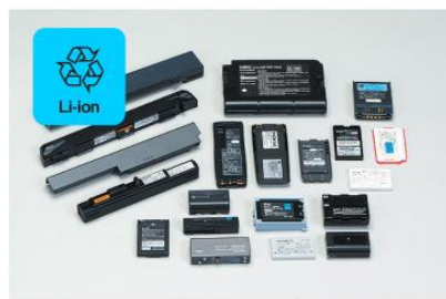
リチウムイオン電池