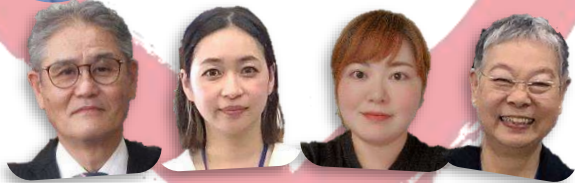
まちづくりセンター職員