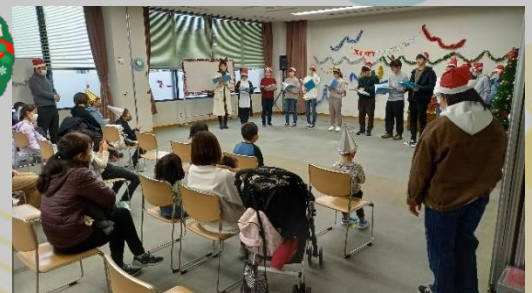
楽しいクリスマス会を過ごしました♪