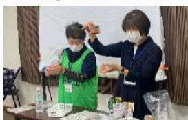
「心も体も元気になる災害食」の 作り方も実演していただきました