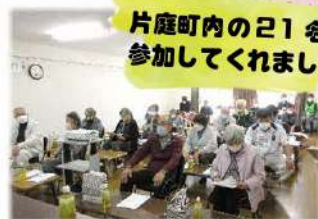
片庭町内の21名が 参加してくれました。

10月29日(土)に片庭まちづくり委員会(片庭連合会)のみなさんと一緒に、防災についての事業を開催しました。どのような内容で実施するのか、片庭町内会長さんたちと会議も開き一緒に考えました。当日は市の防災安全課の方や防災士さん、浜田消防署の消防士さんに来ていただき、防災クイズや災害時の食事の大切さについての座学、実際に救急車出動依頼の119番に電話をかけたり、消火体験をしたり、盛りだくさんな内容で楽しく防災について学ぶことが出来ました。