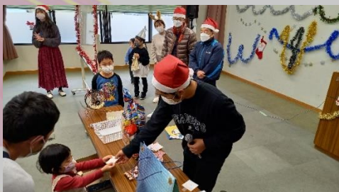
県大の 학생さんと地域の子もたち♡