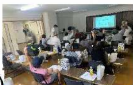
防災クイズ～みなさん 積極的に答えていました！