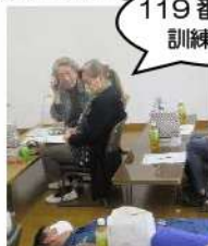
119番のかけ方 訓練です！