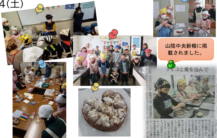
山陰中央新報に掲載されました。

2月4日(土)8組の親子でまちセンバーカーを開催しました。バレンタインに贈りたい人を思い浮かべながらパン作りやメッセージカードを作りました。楽しかった！思い出が残りました！また作りたい！など多くのコメントを頂きました。