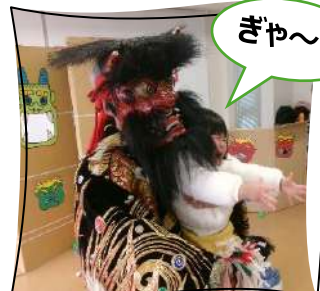
鬼につかまったー!!