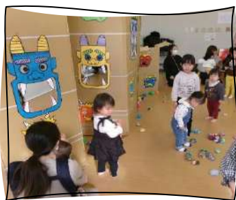
壁の鬼に向かってみんなで「鬼は外〜っ！！」