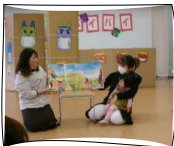
大型絵本の読み聞かせ

毎年恒例の節分行事♪今年もたくさんの親子と地区社協のみなさんで交流を楽しんでおられました！