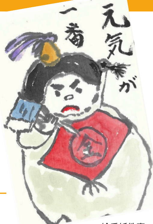
絵手紙教室 「ふきのとう」