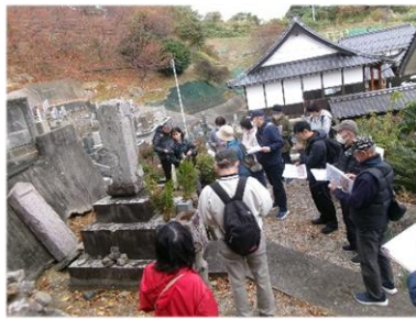
極楽寺（二代将軍徳川秀忠供養塔）