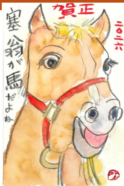
絵手紙教室「はなみずき」

地域の皆さま、令和8年の初春のお慶びを申し上げます。 浜田まちづくりセンターは、今年も地域の皆さまから必要とされる施設として 職員一同頑張っております。