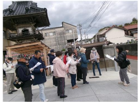
極楽寺の前の辺りが【浜田】と 名前が付いたと言われている場所