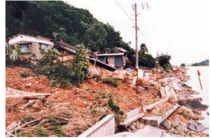
周布川下流鰐石地区山崩れ