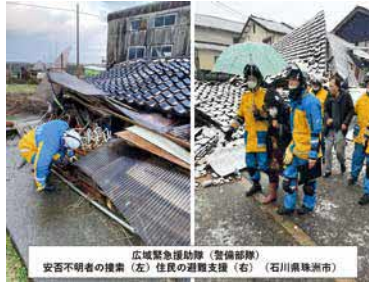
島根県警察広域緊急援助隊 広域緊急援助隊（警備部隊） 安否不明者の捜索（左）住居の避難支援（右）（石川県珠洲市）