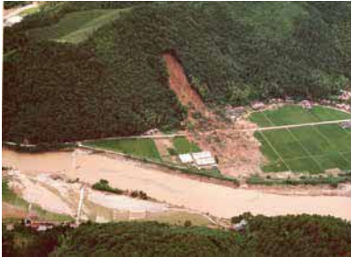
15名の犠牲者を出した穂出町中場地区

各企業・団体から、被災地で救援・復興に尽力された方々の記録写真を提供いただき展示します。