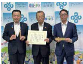
丸山県知事に贈呈