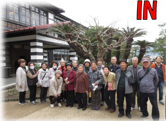
萩・明倫学舎入口 ■開館時間：9時～17時

3月11日 毎年恒例、シニア向けお出かけツアーを開催し、午前は「萩・明倫学舎」の見学に伺いました。