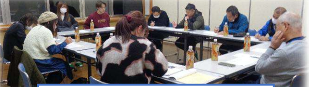
仮・にここ交流部会(現・活性化部会)