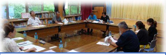
仮・安心たすけあい部会(現・安全安心部会)

今後も皆さんの要望にお応えしながら、よりよい白砂のまちづくりを目指していきますので、ご理解とご協力を宜しくお願いします。