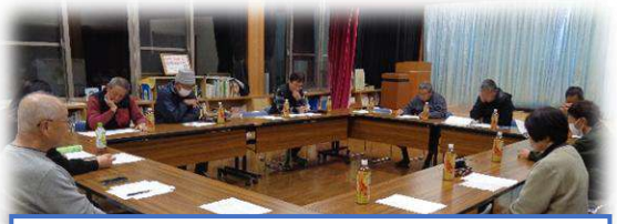
仮・くらしいきいき部会(現・教育振興部会)