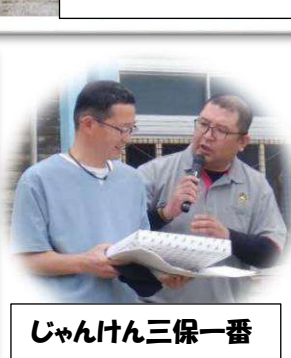
じゃんけん三保一番