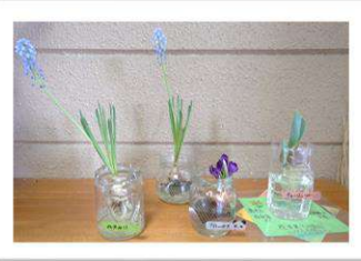
【左からムスカリ・クロッカス・チューリップ】

三隅小3年生よりお花をいただきました。玄関に飾っていますので、お越しの際にはぜひご覧ください。