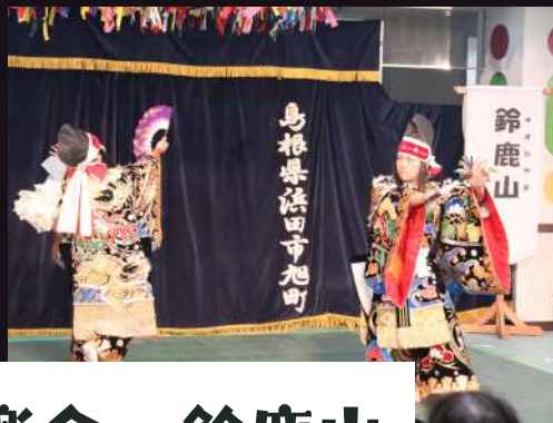
和田神楽会 鈴鹿山