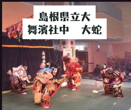
島根県立大 舞濱社中 大蛇