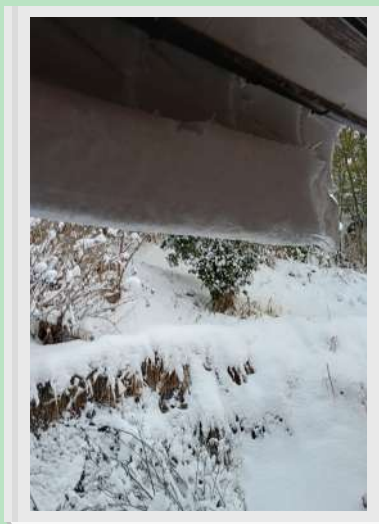
● 雪庇 ● ● こだわり ●