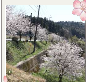
和田小閉校記念植樹