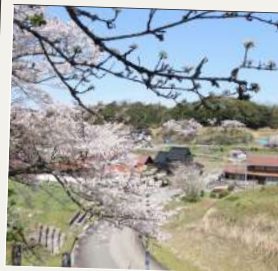
本郷八幡宮の 上り坂からの眺め