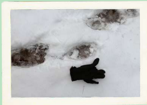
● 冬眠しない熊 ● ● こだわり ●