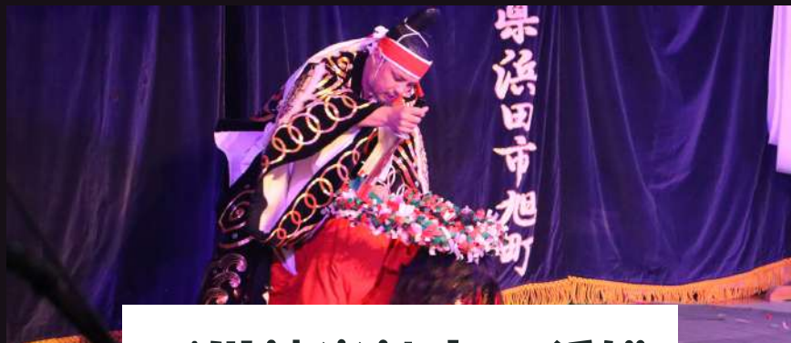
戸川神楽社中 鍾馗