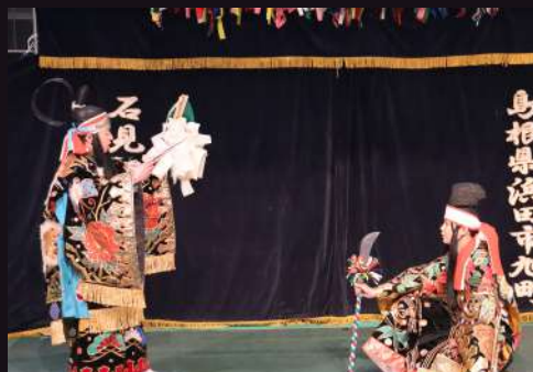
本郷神楽社中 天神