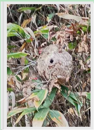
● スズメバチの巣？ ● ● こだわり ●