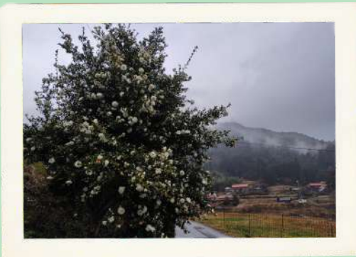
● さざんかと城山 ● 鷹の爪団 ----- エピソード さざんかの先に、 ● 城山が見えます。 ●