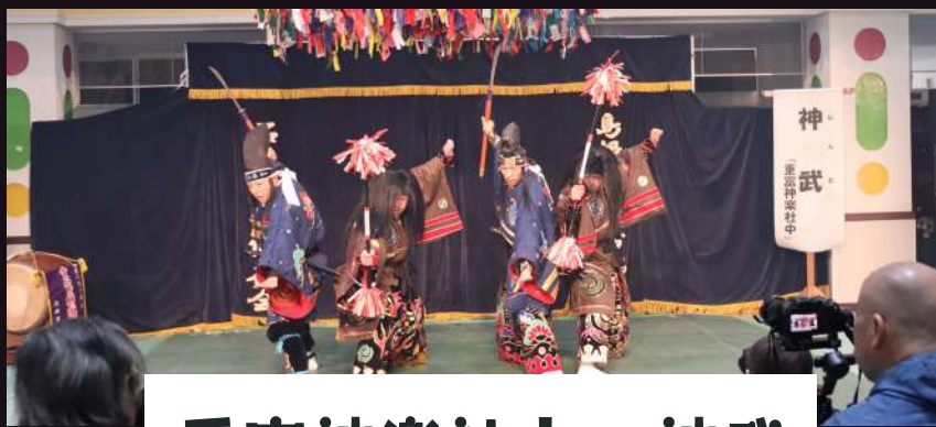
重富神楽社中 神武

観客席のすぐ傍でそれぞれの工夫された演目演出やこの日だけの和田地区合同の8頭の大蛇に約100人の来場者もその迫力に見入っておられ、動画や写真を撮られていました。また、地域有志の飲食コーナーも賑わいをみせていました。