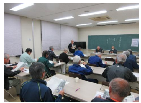
今福線冊子研修会の様子