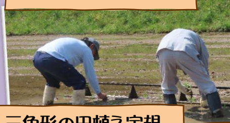
三角形の田植え定規。 昔の人はこんな工夫 をしてたんですね！