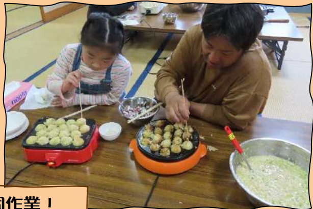
親子仲良く共同作業！