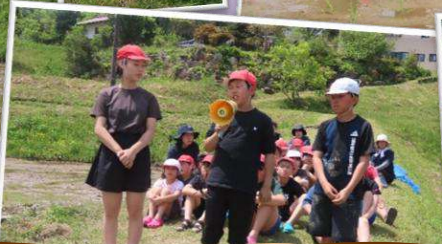
最後は6年生による感想発表です。 「下級生にも教える事ができました！」