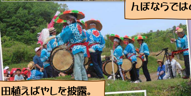
田植えばやしを披露。

5月7日(木)天候に恵まれ今福小全校児童35名により田植えが行われました。始めに久佐・上長屋の田ばやし保存会による“田植えばやし”が披露され、お米の豊作を願いました。そしていよいよ田んぼの中へ！ズラリと並び、地域の方に指導していただきながら、丁寧に苗を植えていきました。中には尻もちをつく児童も！泥んこになりながら、田んぼならではの感触を体験しました。