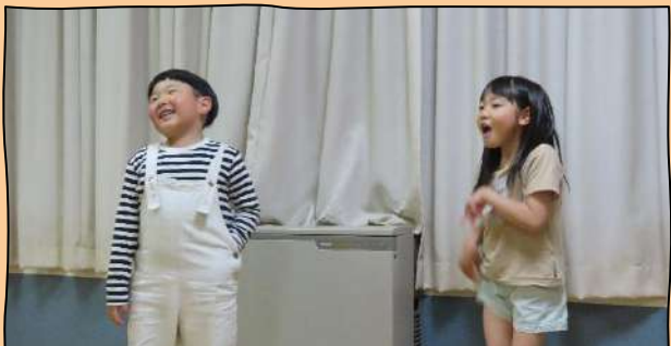
可愛い新1年生の紹介では、これから頑張りたいことをみんなの前で発表しました。