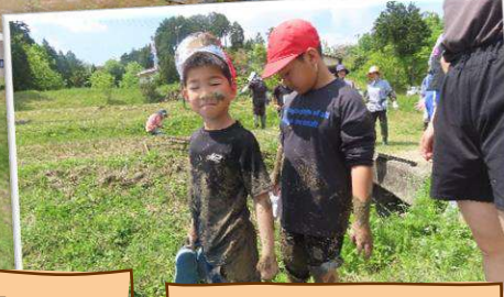
泥んこを堪能し、 満面の笑顔！