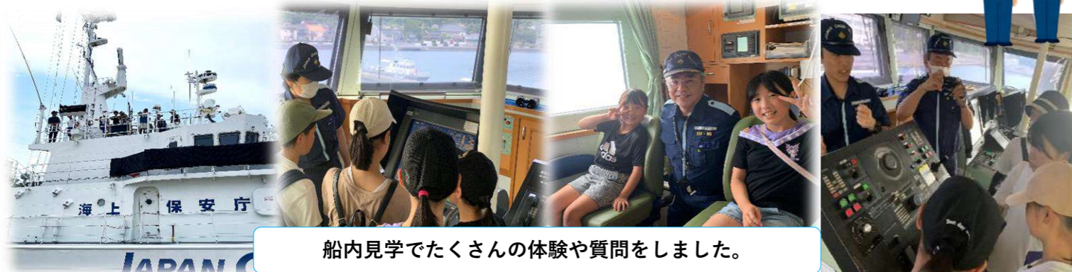
船内見学でたくさんの体験や質問をしました。