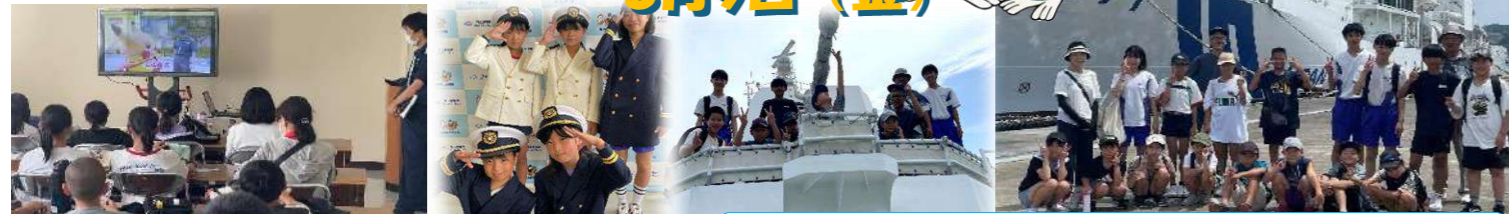
海上保安部の仕事について・制服の試着