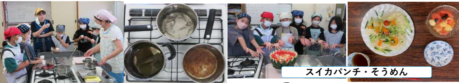
スイカパンチ・そうめん