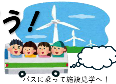
バスに乗って施設見学へ!

中々目にする事のない施設見学に、参加されたみなさんは担当者のお話をしっかりと聞き、「節電・資源・水の大切さ」を改めて実感され、良い学びの場となりました。身近な学びをこれからも行っていきます。