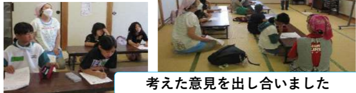
考えた意見を出し合いました