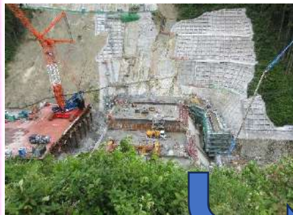
R3.6月 建設中の波積ダム