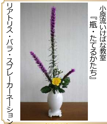
小原流いけばな教室 『瓶・たてるかたち』

◆国府地区人口◆ (3月末) 世帯数 2,637世帯 (-15) 人口合計 5,489人(-41)