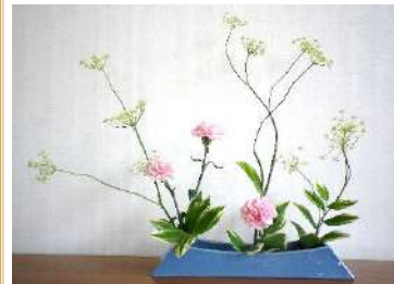
ウイキョウ・カーネーション 鳴子百合