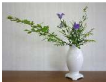
山錦木・桔梗・ソリダコ