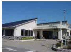
小原流いけがね教室 『ならぶかたち』