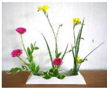
フリージア・ガーベラ・鳴子百合

◆国府地区人口◆ (2月末) 世帯数 2,652世帯 (+8) 人口合計 5,530人(+6)