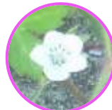
白花 ゲンノショウコ