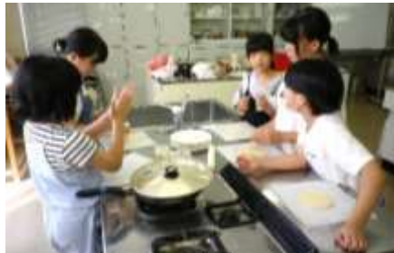
ハムチーズピタパンとフルーツサンドを 作って食べました！