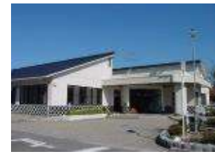
小原流いけぬ教室 『ひらくかたち』

3月 第47号 【国府まちづくりセンター】 浜田市国分町 1981-136 TEL&FAX 28-1270 ☒ kokufu-k@ph-hamada.jp