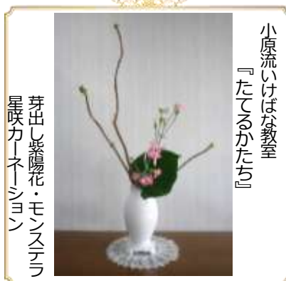
小原流いけばな教室 『たてるかたち』