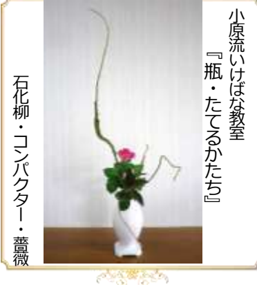
小原流いけばな教室 『瓶・たてるかたち』