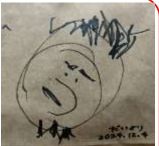
息子が私の似顔絵を描いてくれました(^^)/だんだん人間に近づいてる!!

あっという間に年が明けてしまいました!今年もよろしくお願ひします。私の去年の漢字はズバリ麴(こうじ)と遊でした。2月に息子からアデノウィルスもらい、重症化して入院をしました。それからは健康について考えるようになり、腸を鍛えるために食事に麴を取り入れることにしました。すると息子は熱が出て月に最低1回は保育園からお迎えの電話があったのですが、麴を取り始めた3月から今までお迎えの電話が0回!お休みしたのは3日間だけ!(ヤッター!)夫の重度の花粉症や私の肌荒れも治り、もちろん健康!麴様様の1年でした!あとは健康だったおかげで息子は遊びまくる!休日は朝からお昼寝もせずに公園で遊ぶ!ママも滑ってと言われ、高所恐怖症なのにアクアスランドの長い滑り台と一緒に遊ぶ!そんな1年でした。