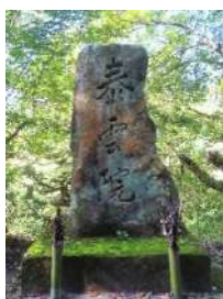
甚左衛門顕彰碑 (伊木町内会)

また、秋には小学生との登山も計画しています。春の登山の写真を見て、たくさんの方の参加を期待しています。