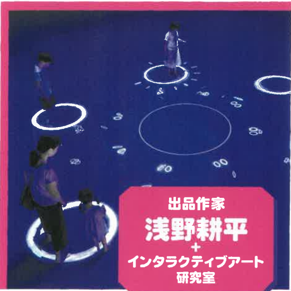
出品作家 浅野耕平 + インタラクティブアート 研究室