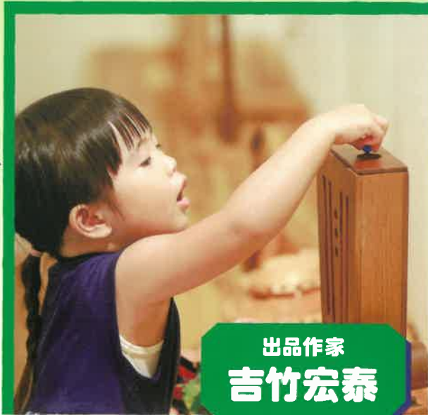
出品作家 吉竹宏泰