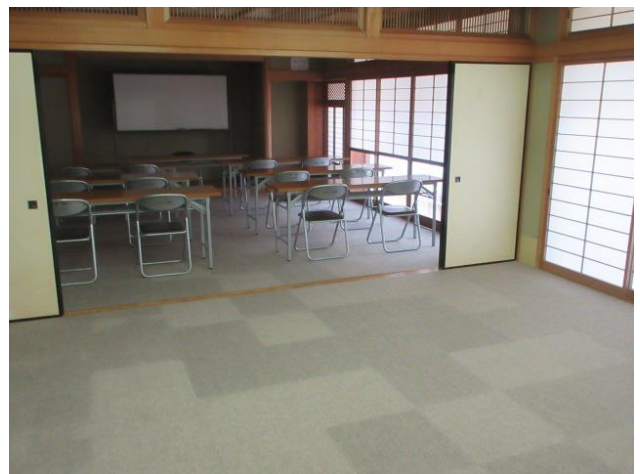
和室 1 (奥側)、和室 2 (手前)