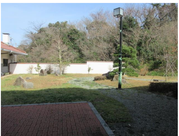
庭園（体育館側から撮影）