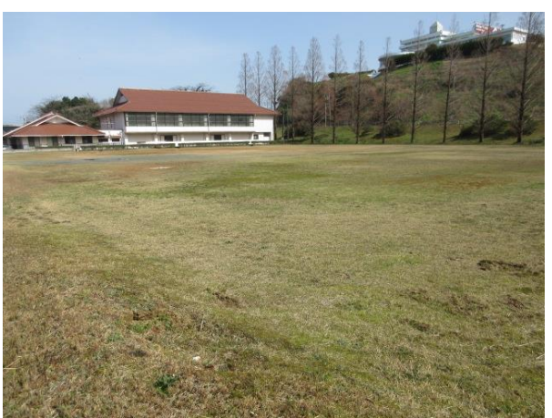
水産加工団地グラウンド（市水産振興課管理）