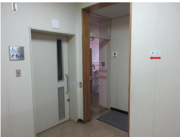
多目的トイレ、男子トイレ、女子トイレ