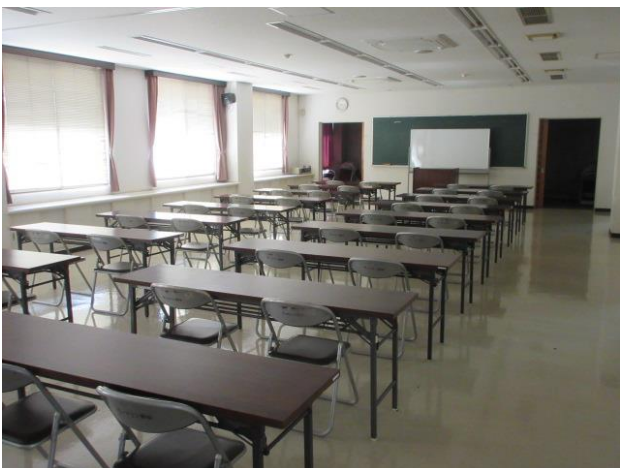
研修室 A（奥）・研修室 B（手前） ※連結した状態