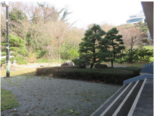
庭園（エントランスホール側から撮影）