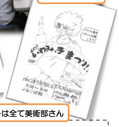
チラシ・ポスターは全て美術部さん