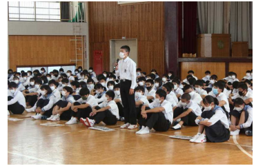
○野球部キャプテンの抱負

9月27日には浜田市駅伝や浜田市の新人戦の壮行式を行い、新チームのキャプテンが大会に向けての熱い決意を述べてくれ、9月29日の駅伝を皮切りに新人戦がスタートしました。また、2学期は生徒たちが夏休みに取り組んだ作品や授業で取り組んだ作品のコンクール等も沢山あります。浜田一中生が日々頑張っている取り組みの成果が見られるのを楽しみにしています。