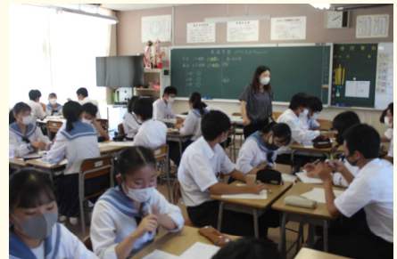
○3年生、学活で計画を立てています。

コロナウイルス感染症の関係で昨年度は全国学力・学習状況調査が行われませんでした。今年度は5月27日に3年生を対象に国語、数学、生徒質問紙調査が実施されました。国語、数学ともに平均正答率が県平均以上でした。日ごろ授業で頑張っていることが確認できました。生徒質問紙調査では「家庭学習の時間」や「自分で計画を立てて学習すること」が以前と同じように課題として見えてきました。一中では全学年で10月4日から『学習時間パワーアップチャレンジ』を実施しています。計画を立て、学習時間のアップを目指して頑張ってもらいたいと思います。保護者の皆さんの協力をお願いします。