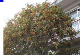
☆満開のキンモクセイ

やっと浜田一中のキンモクセイの香りが漂ってきました。例年なら9月終わりから10月の初めには開花しますが、今年は約1月近く遅れての開花となりました。キンモクセイは日照時間ではなく気温で開花時期が決まるそうです。10月26日に予定していた6年生の授業・部活体験は中止になりました。少しでも6年生に中学校を知ってもらおうということで、生徒会で活動記録を作成しています。また、この学校便りを大きく引きのばして6年生の教室に貼ってもらっています。今回の便りは6年生へのメッセージも入れています。