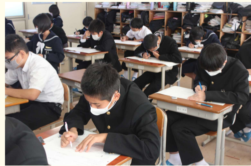
☆1年1組数学のテスト頑張っています。