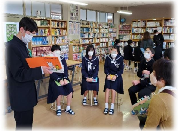
あらかじめ選書した絵本の読み聞かせ、練習をした成果が感じられる生徒も。

3年生達の小学生時代に、朝の読み聞かせをしてくださったボランティアの方も多数ご参加くださり、成長した子どもたちとの再会は、嬉しいひとときとなりました。