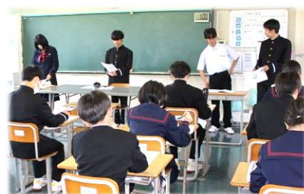
専門委員会からの説明

学級生徒会の中で解決しなかったことは、5月21日(木)に行われる生徒総会で回答されます。今年のキーワードの『まず動く』も意識しながら、この学級生徒会、生徒総会を通じて活発な生徒会活動につながることを期待しています。