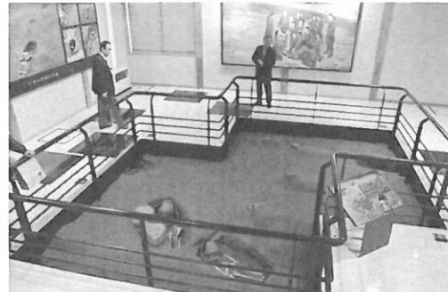
埋葬されたモヨロ人の展示