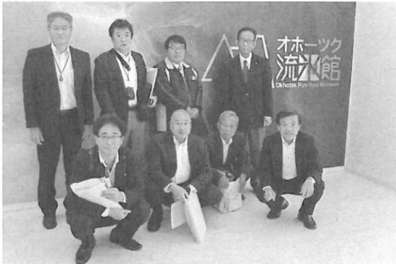
オホーツク流氷館にて

この施設は、オホーツク固有の魚類(クリオネ、なめだんご)の展示、流氷展示室でマイナス20度の世界が体験出来る。