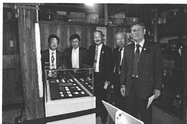
(蔵の中で展示されている、大判・小判や古銭)