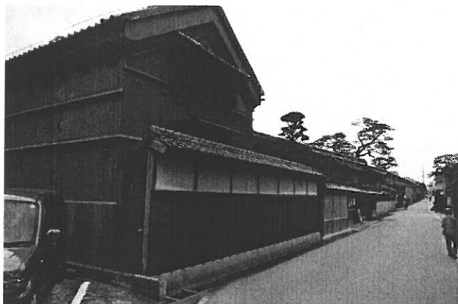
(市役所近くにある、魚町通りにある旧長谷川邸)

邸宅は、江戸時代の木綿問屋「丹波屋」。格子、霧よけ、妻入りの蔵など 5 つあり、建物に使用されている建材は職人さんがいなくて、もう入手できないものもあると言う事でした。そして、うだつの上がった屋根など落ち着いたたたずまいの中に、当時の松阪商人の隆盛ぶりがうかがえる大きな屋敷で、その当時の当主が集めたであろう大判・小判や古銭が近年になって見つかり、一つの蔵で展示されていました。