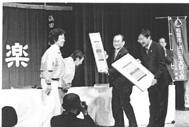
（両市友の会、会長より記念品贈呈）