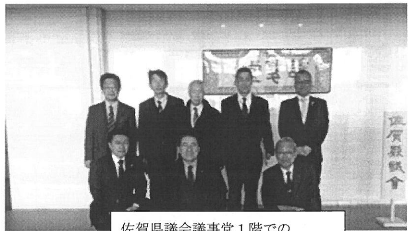
佐賀県議会議事堂1階での参加メンバーの集合写真