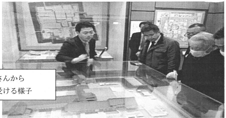
佐賀城本丸歴史館の学芸員さんから全体模型を見ながら説明を受ける様子