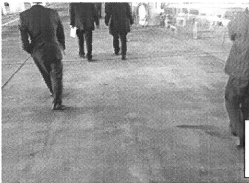
唐津魚市場のコーティングされた床面を視察