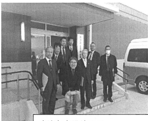
唐津魚市場前での参加メンバーの集合写真