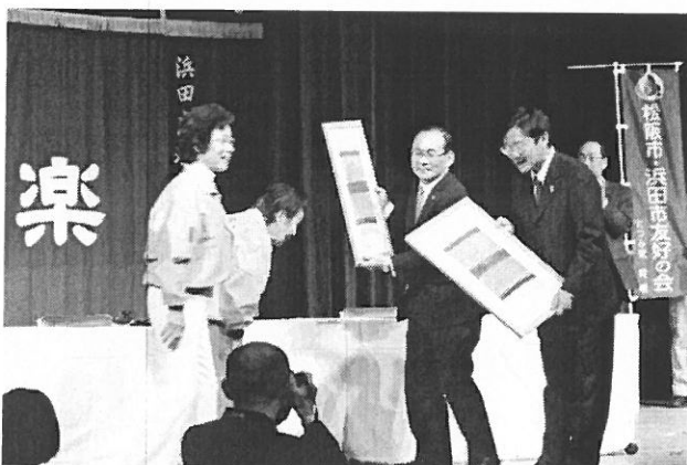
（両市友の会、会長より記念品贈呈）