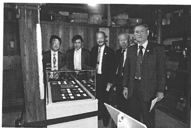
(蔵の中で展示されている、大判・小判や古銭)