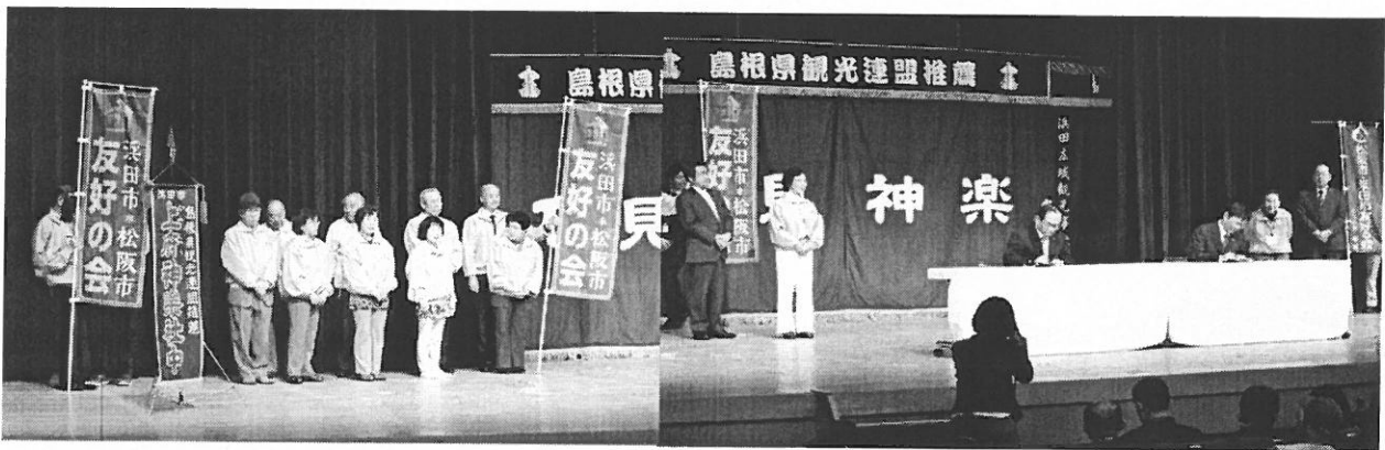
（記念セレモニーで関係者や両市議会議長が見届ける中、調印される両市長）

また、上府神楽社中による「恵比寿」の上演に合わせて、タイ釣りの代わりに、「祝・駅鈴協定締結記念」のノボリを釣って頂き、両市長と関係者、会場の松阪市民全員で万歳三唱して祝いました。