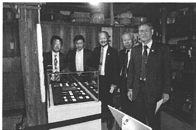
(蔵の中で展示されている、大判・小判や古銭)