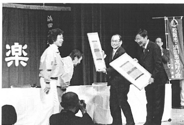
（両市友の会、会長より記念品贈呈）