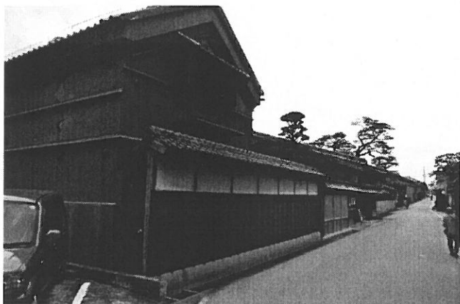
(市役所近くにある、魚町通りにある旧長谷川邸)

邸宅は、江戸時代の木綿問屋「丹波屋」。格子、霧よけ、妻入りの蔵など 5 つあり、建物に使用されている建材は職人さんがいなくて、もう入手できないものもあると言う事でした。そして、うだつの上がった屋根など落ち着いたたたずまいの中に、当時の松阪商人の隆盛ぶりがうかがえる大きな屋敷で、その当時の当主が集めたであろう大判・小判や古銭が近年になって見つかり、一つの蔵で展示されていました。