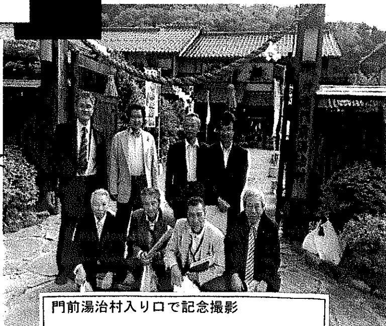
門前湯治村入り口で記念撮影

当浜田市においては、現在地域の活性化のために廃校等利用して神楽公演など実施し一生懸命努力されているところもあります。こうしたことに影響与えるような構想は、今後検討を要するのではないかと感じました。むしろ新たな建物より今まで実施されているように、今ある遊休施設を有効に活用することの方が必要と感じました。