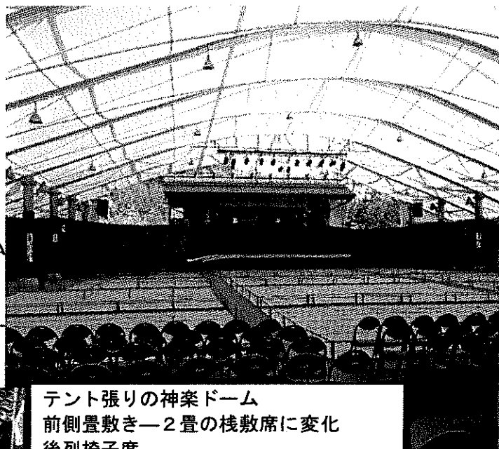
テント張りの神楽ドーム 前側畳敷き—2畳の棧敷席に変化 後列椅子席

所感 多額の事業費を使って建設された神楽ドーム年間5千万近い一般会計からの繰り入れをして議会かからも厳しい意見が出ているとのことのお話でした。浜田市においても神楽会館建設の構想が出ていますが、慎重に検討する必要があると思っています。