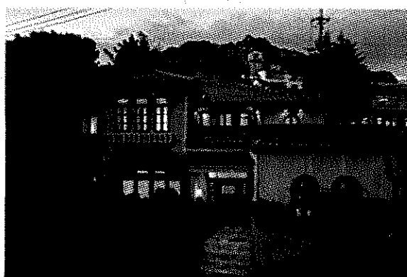
せとうち湊のやど