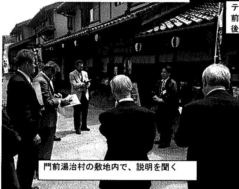
門前湯治村の敷地内で、説明を聞く