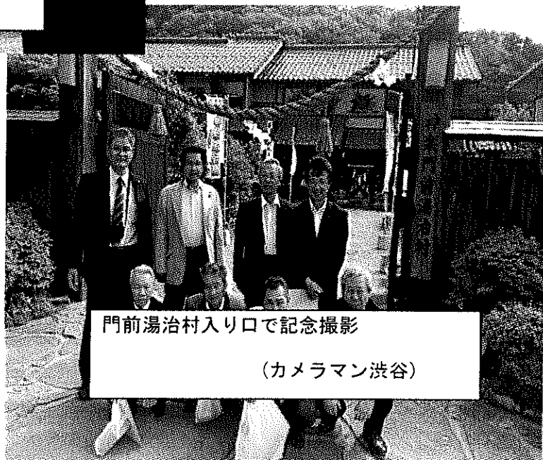
門前湯治村入り口で記念撮影