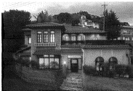
せとうち湊のやど