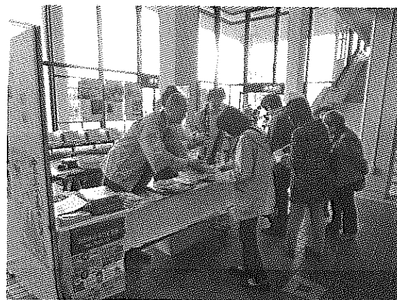
（浜田市の特産品販売と観光情報PR）