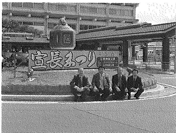
（松阪市駅前の駅鈴モニュメント）