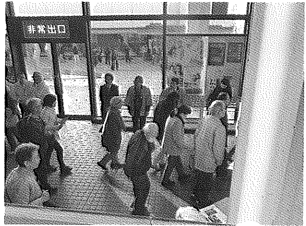
(神楽観賞後、沢山の市民の皆様をお見送り)