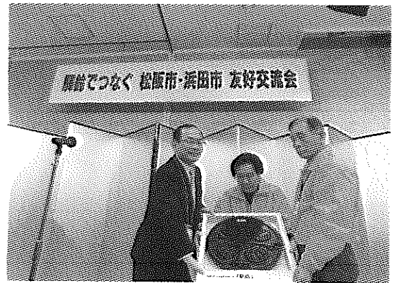
(駅鈴模様のマンホール、友好の会より贈呈される)