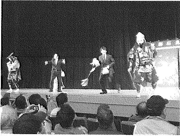
(石見神楽上演にみなさん興奮しています)