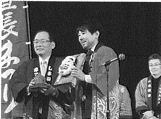
(両市長より浜田からは神楽面、松阪からは駅鈴贈呈)