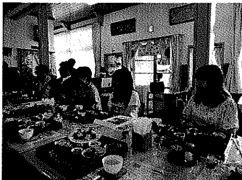
村長、議長、大学生他

浜田市内でも、地元食材を使用した活動がなされているので、そういった団体をうまく活かして、よそから人を呼び込む方策が考えられないものか、今後の課題としたい。