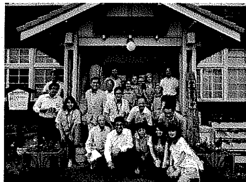
時代の駅むらやくば(レストラン)