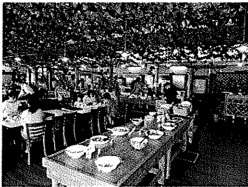
ぶどう畑のレストラン

「おおむら夢ファーム シュシュ」では、働く方々の表情の明るさ、施設の雰囲気等がとても印象的だった。ここでの取組は、金城ウェスタンライディングパークでも展開可能ではないかと感じたところである。また、浜田市の道の駅や、瀬戸ヶ島地区などの構想にも参考になると感じた。