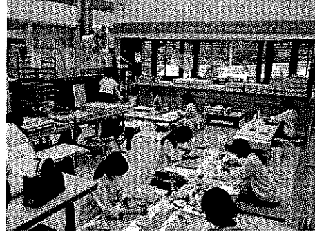
国宝修理装演師連盟の職員