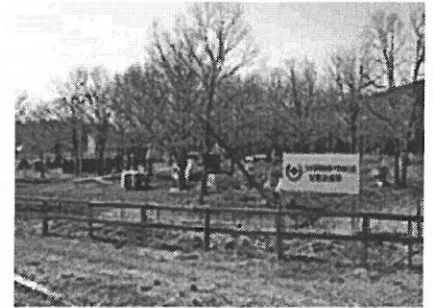
▲エルランチョグランデ

牧場体験で修学旅行等も受け入れ、ホースセラピーを取入れて、障がいの有る方の様々なニーズにも対応している。