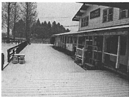
雪のエルランチョグランデ