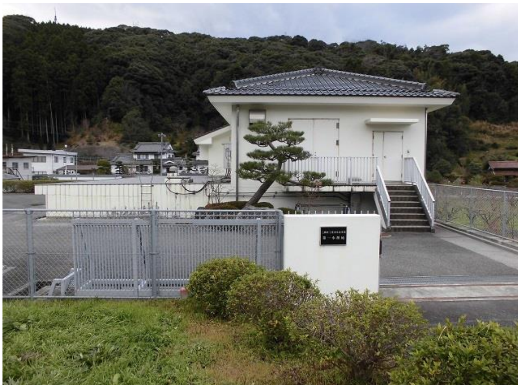
浜田市工業用水道事業 第1水源地