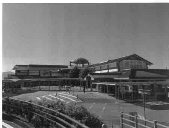
新しく生まれ変わる ゆうひパーク浜田

〔答弁〕 ゆうひパークは夕日の景観を生かし楽しむため、市場、産直市場など直売所の強化、魅力的なレ스토랑、情報発信機能の充実、地域の魅力を発信し人に愛される施設とするよう検討している。