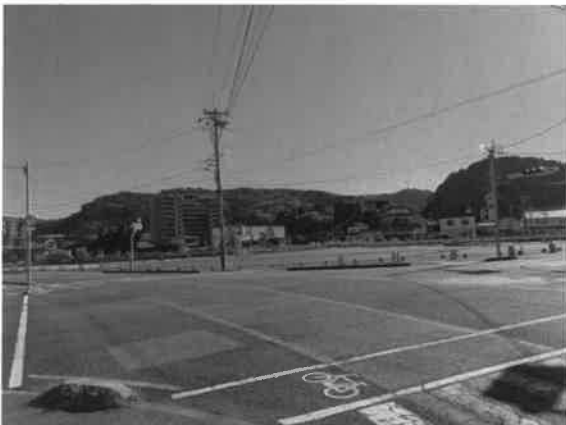
賑わいづくりが待たれる 三桜酒造跡地

検証の結果、課題が明らかになり、駅周辺には教育文化、商業、宿泊などの施設が集積し、賑わい創出が