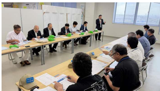
関係者との意見交換