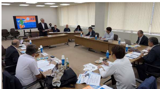
松浦市議会議長歓迎のあいさつ

・「アジフライの聖地 松浦」推進事業では、アジの水揚量日本一という強みを「アジフライ」という分かりやすい形でブランド化し、市民や事業者を巻き込みながら継続的な情報発信やイベントを展開している点が印象的であった。単なる特産品 PR ではなく、「聖地」というストーリー性を持たせることで地域全体の魅力向上につなげていた。