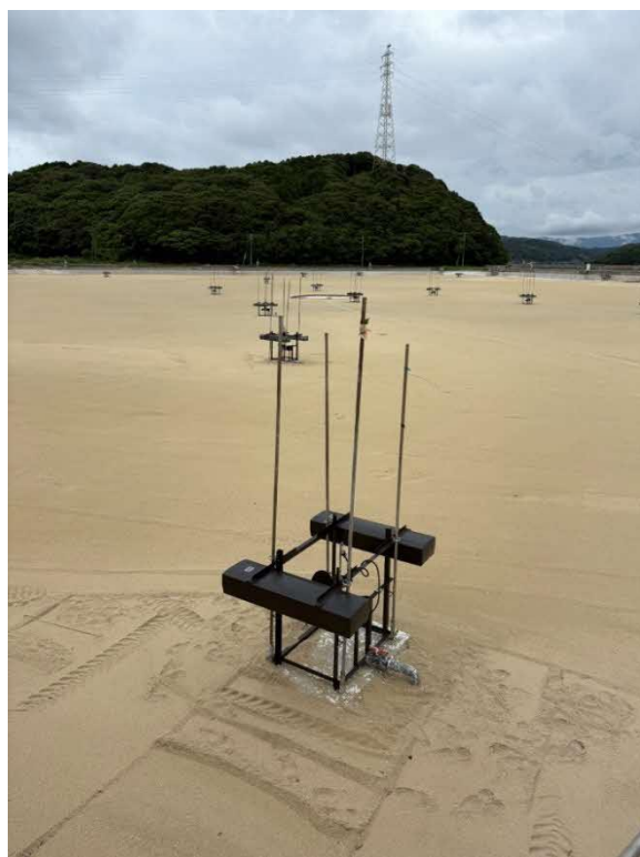
養殖場現在は、水を抜いて掃除の段階