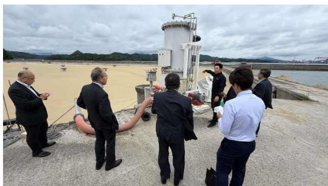
高濃度酸素供給設備の説明

生産技術だけでなく、豊洲市場への継続的な出荷、食育活動、地域イベントへの参加など、生産から販売までを一体的に取り組んでいる点が非常に参考になった。浜田市においても高付加価値水産物の育成を目指すのであれば、養殖技術の検討だけでなく、販路開拓やブランド戦略を含めた総合的な取組が必要であると強く感じた。