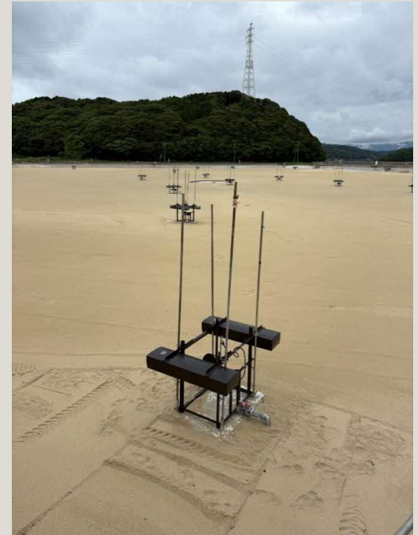
養殖場現在は、水を抜いて掃除の段階