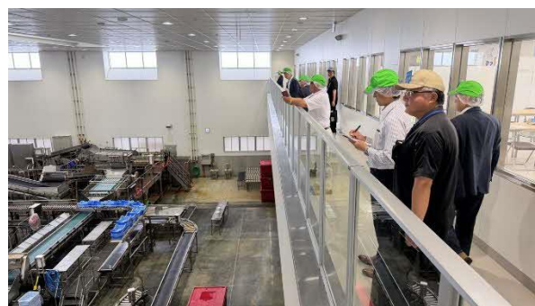
施設内の視察状況