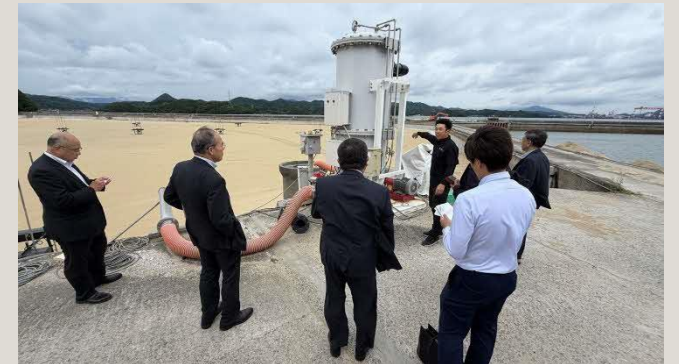
高濃度酸素供給設備の説明

[体制] 常勤4名、パート3～4名、潜水土資格保有者3名（最大4時間に及ぶ潜水作業に対応）。