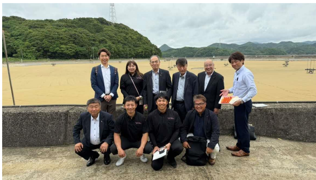
くるまえび養殖場をバックに関係者との写真