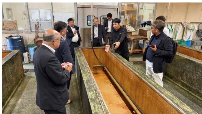
えびの選別(水揚げ)