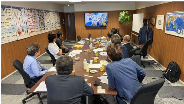
会社の説明を受ける