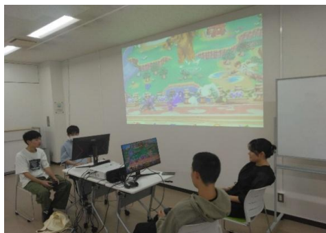
島根県立大学eスポーツサークルEWLG主催 「eスポーツイベント」