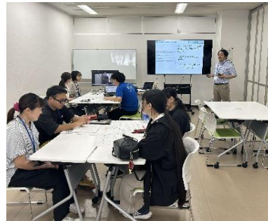
はまだ協働学舎ファンタス主催 「SHIMANEみらい共創CHALLENGE」