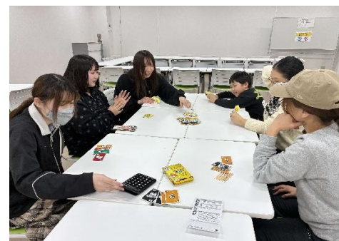
英語サークル浜田主催 「子どもたちが英語に親しむイベント」