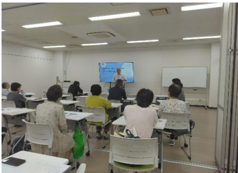
島根県立大学連携交流課主催 「公開講座」