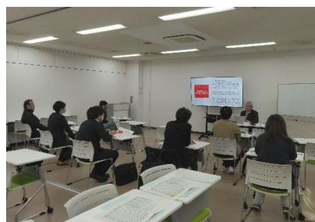
浜田商工会議所主催 「後継者・若手経営者のための財務入門セミナー」