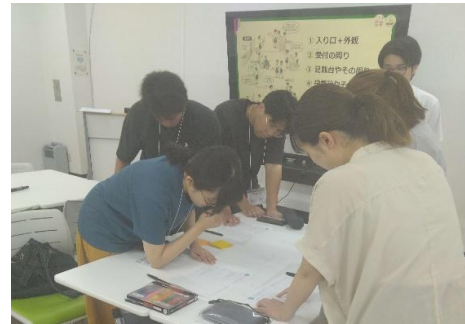
しまね県大政経塾主催 「浜田市内の小中高生の主権者教育」