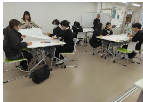
Youth Activist Club 主催 「交流会」