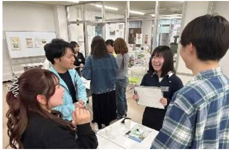
島根県立大学学生主催 「学生×地域 ご縁広場」