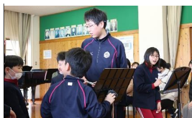
2学級の伝言ゲーム