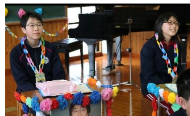
出し物を楽しむ6年生