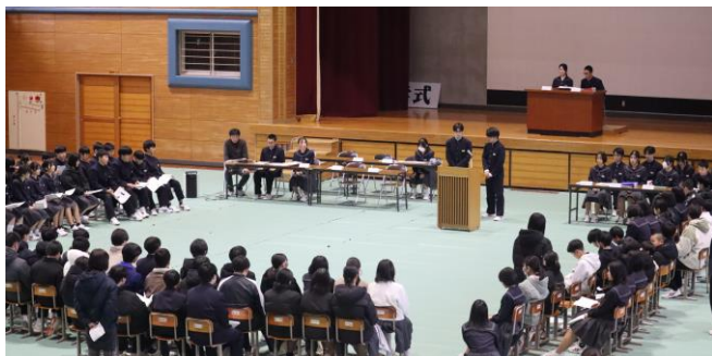
<生徒総会の話し合いの様子>

生徒総会では、新役員は堂々と自分たちの活動計画を説明しました。新たなアイデアが示されたり、学級からの質問や意見に対してその意図を問い返したり、出された意見を取り入れようとしたりするなど、対話によって話し合われる場面もいくつかありました。今後も活発な生徒会活動が展開されることを期待します。