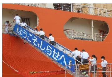
<「しらせ」見学の様子>