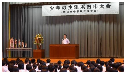
<少年の主張浜田大会の様子>

それぞれの思いを伝え、受け止め合う活動はこれからの生徒の成長にとってとても大切なことです。これからも弁論などを通じて多くの皆さんの思いに触れるとともに、生徒の皆さんが様々な考え方に会う機会を確保していきたいと思えます。