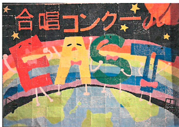
<「EAST」を描いた全校生徒の作品>

生徒会総務部が企画したオープニングでは、全校生徒の気持ちが合唱コンクールに向けて高まるように、全校生徒で分担したパーツを貼り合わせた作品のメイキング画像を交えた寸劇と、完成した作品の披露がありました。