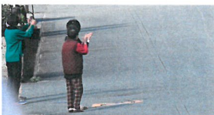
<ロードレースのスタートと沿道の声援>