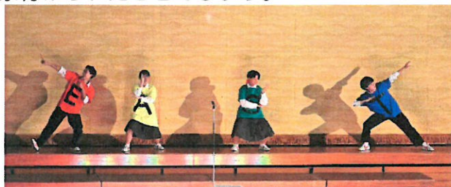
<クロージングの一場面>

合唱コンクールを締めくくるクロージングでは、生徒会総務部のメンバーが生徒会スローガン「EAST」のそれぞれの文字に扮して、楽しいやり取りを見せてくれました。現在の執行部の任期もあとわずかになりました。この1年間の確かな足跡の一つとして、皆の心に深く印象付けられたことでしょう。