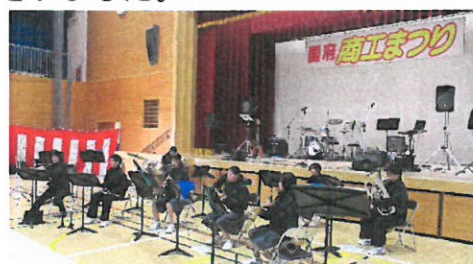
<国府商工まつりでの演奏の様子>

吹奏楽部は国府商工まつりにも出演させていただきました。ご協力いただいた皆様、ありがとうございました。