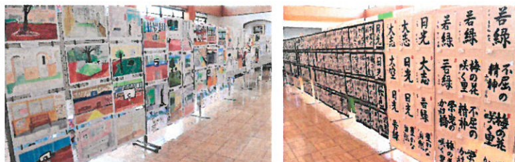
<多目的ホールの展示会場の一部>

多目的ホールでは各学年の総合的な学習の時間の成果や教科での作品が展示されました。ユニークな自画像などの美術作品や斬新な視点の科学作品、丁寧に仕上げられた家庭科の作品などが一つの空間に凝縮されていて、繰り返して見るたびに新しい感動がありました。