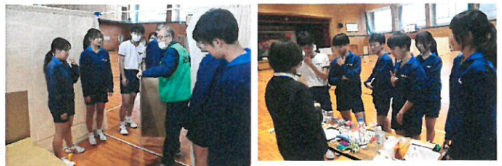
<段ボールの組み立てや防災食の試食の様子>

11月16、17日の2日間にわたって3年生の技術・家庭科の学習で「避難所体験」が実施されました。市の防災安全課にご協力いただき、地域講師の皆さんのご指導を受けて、実際に避難所の造設をして、段ボールベッドで寝てみたり、防災食を食べてみたりしました。いざという時の生活について学び、意識を高めました。