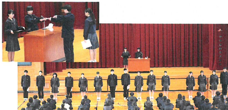
<生徒会役員委嘱式の様子>