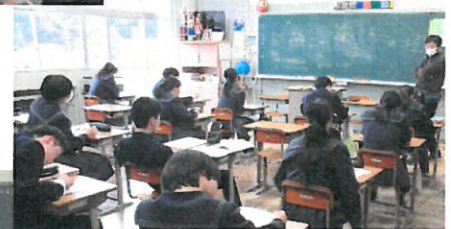
<↑公転と自転を考察>