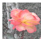
<←移植して元気に咲いているアンのバラ>