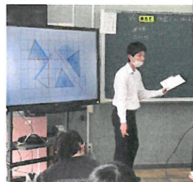
<↑ 図形の学習 →>