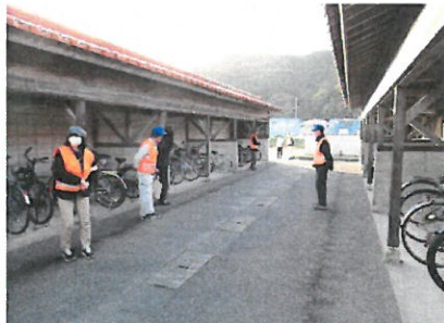
<浜田市少年補導委員国府支部の皆様>