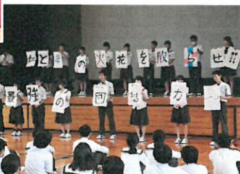
<体育祭スローガン発表>