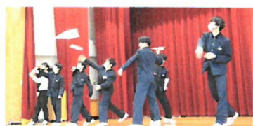
<紙ヒコーキ選手権>

4月からの様々な場面を振り返ってみると、生徒は自分たちのめざす姿に向かって確かな歩みと成長を遂げたように思います。今年度の活動を基盤にして、次年度も浜田東中学校の更なる発展を目指していきます。