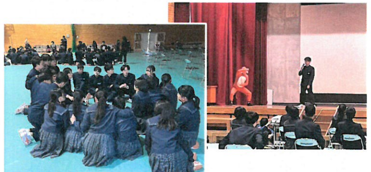
<3年生を送る会の様子>

3月7日(木)には、新生徒会の企画運営により、「3年生を送る会」が行われました。入場では3年生との思い出のアイテムでもある「紙ヒコーキ」を飛ばして迎えました。飛ばした紙ヒコーキには、在校生が感謝の気持ちを書き込んでいて、会の後には廊下に掲示されました。その後は工夫を凝らしたクイズが行われ、学級ごとに円になって力を合わせながら答えていました。そして、3年間の思い出が詰まったスライドショーによって、卒業式を迎える3年生の気持ちが一気に高まりました。