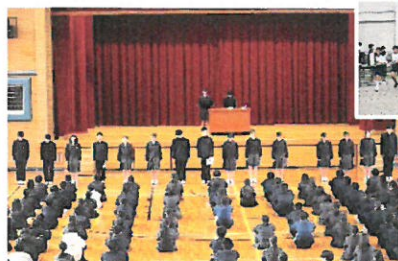
<新生徒会役員任命式>