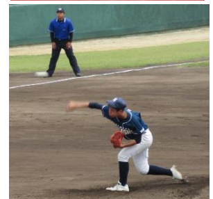
<ブロック大会の様子>