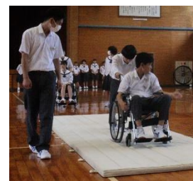
<ブラインドウォーク(左)と車いす体験(右)>