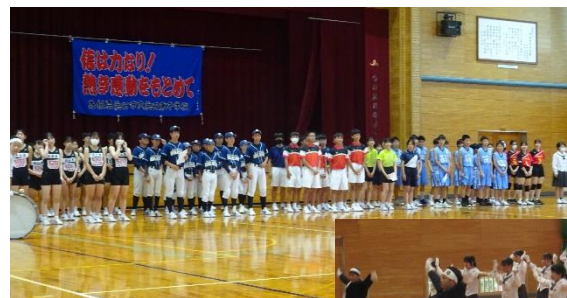
<壮行式の応援の様子>

美術部制作の応援ポスターも各部に贈呈されました。今年も力作がそろっていました。がんばってほしい気持ちを声やポスターで表すことによって、一層強く確かに伝わるものだとして改めて実感しました。