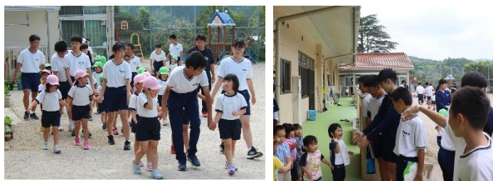
<ふれあい体験での様子>

6月15日(木)と6月19日(月)に、2年生各組が上府保育園で「ふれあい体験」として保育実習をさせていただきました。園児の皆さんの明るい笑顔に負けないくらいの、2年生のはじける笑顔とお兄さんお姉さんらしい振る舞い。保育園職員の皆様にも楽しく活動できるよう導いていただきました。充実した楽しい時はあっという間に過ぎてしまいました。多くの生徒が体験の機会を楽しみにしています。今後ともよろしくお願いします。