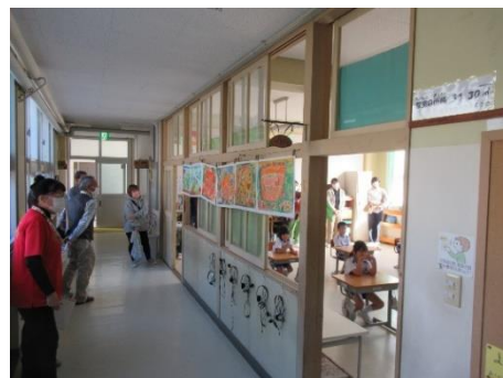
10月31日(火) 10月授業公開

21世紀は「人権の世紀」と呼ばれていますが、いじめや虐待、インターネット上の人権侵害、差別や偏見など多様な人権問題が依然として多数存在しています。戦争という最悪の人権侵害のニュースが毎日飛び込んでくる現実を、子どもたちはどうみているのでしょうか。改めて、全ての人権を尊重する大人になるために、学校と家庭、地域が一緒になって子どもを真ん中に置いた「人権教育」を進めていく必要を強く感じます。