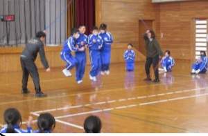
技披露 ダブルタッチ

練習成果を発表する、技のコツを見つける、心を一つにするというねらいで、恒例の「縄跳び集会」を行いました。この日を目指して体育の時間や業間休みなどで練習を重ねてきただけに、みんな一所懸命。高度な技も織り交ぜながら、縄跳びを大いに楽しんでいたので、応援にも力が入りました。