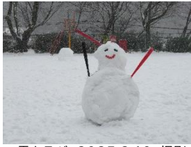
雪あそび 2025.2.10 撮影