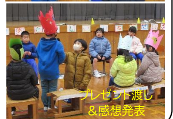
プレゼント渡し &感想発表